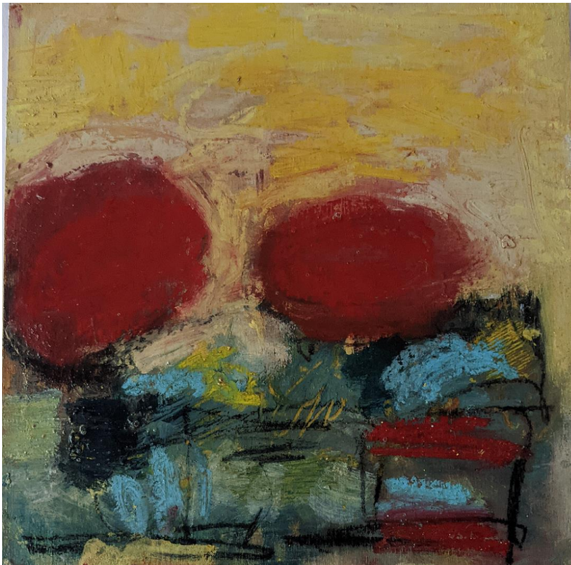
Illustration : Je suis l'étrangère incarnée_1, Véronique Besançon, 2017 (acrylique et pastel sur bois)

Santé et mieux-être au travail : Pourquoi, comment et l'OSMET